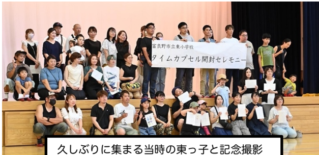
久しぶりに集まる当時の東っ子と記念撮影

8月11日、東小学校体育館で50周年記念事業として、開校20周年と30周年の時のタイムカプセルを開封しました。今から20年前と30年前に埋められたもので、当時関わった方に案内状を送り、約150人ほどが集まりました。久しぶりに会う同級生と当時を懐かしみながらカプセルの中にあった未来の自分に宛てた手紙や担任の先生からのメッセージなどを見つけ思い出話などに花を咲かせていました。